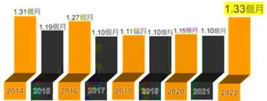
最近9年 當年度平均年終獎金